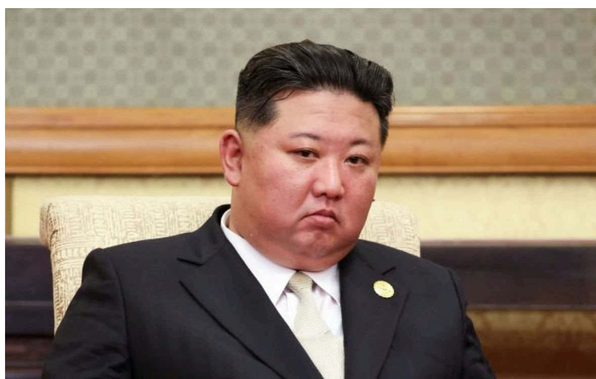
Фото: лідер КНДР Кім Чен Ин