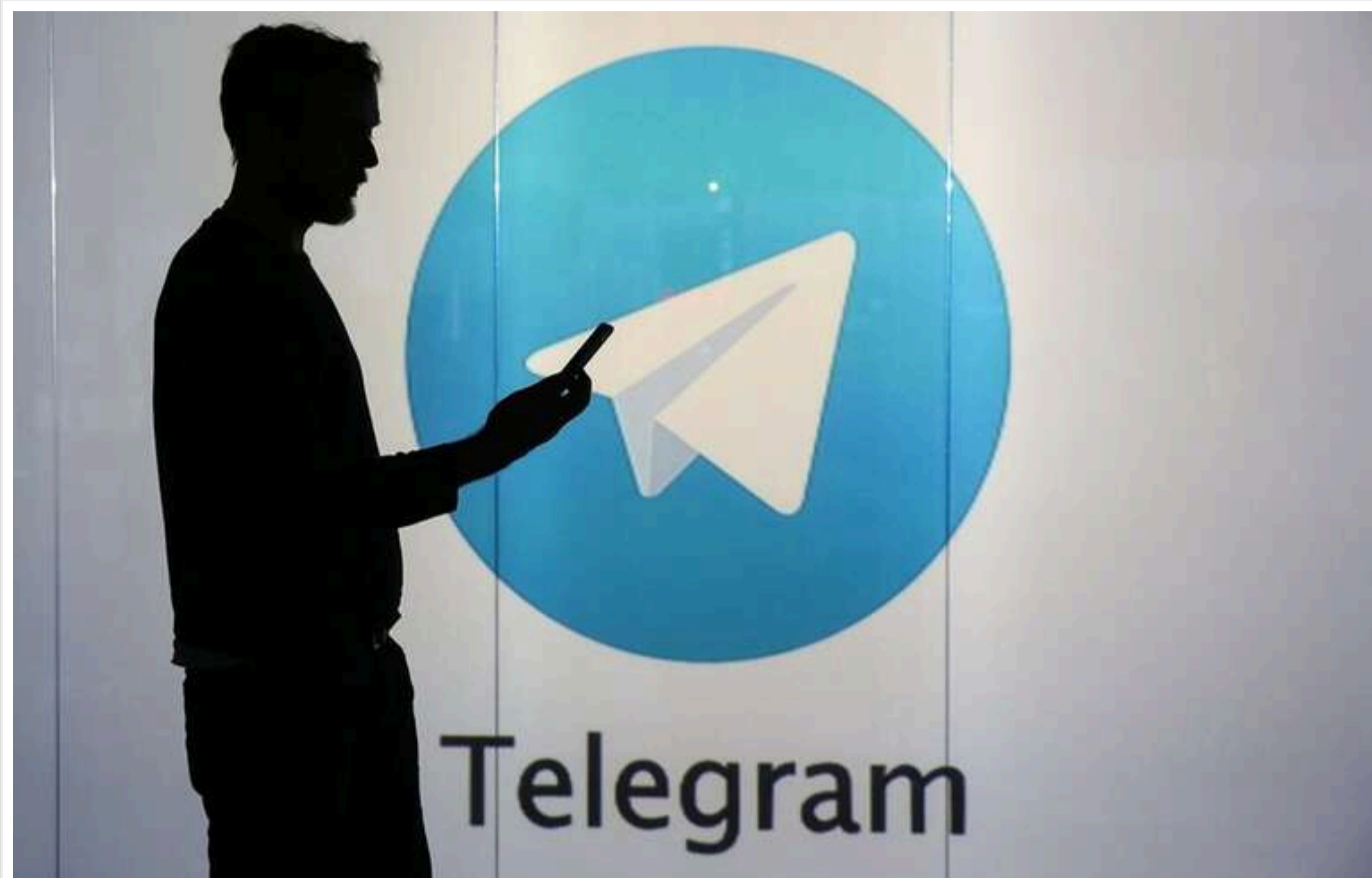
Ресурс із мільйоном підписників: Telegram видалив канал ВЧК-ОГПУ після публікацій про позови до Чубайса та розслідувань проти російських силовиків

Представники каналу ВЧК-ОГПУ, який зник після інформації про позов до Анатолія Чубайса та інших топменеджерів "РОСНАНО", заявили, що, можливо, ресурс був видалений адміністрацією Telegram.