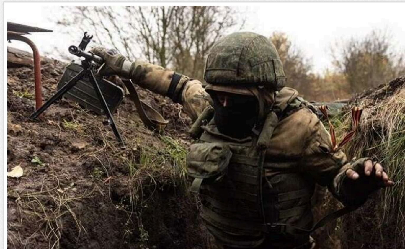
ЗС РФ просунулись на південь від Покровська, - DeepState

Військова спільнота DeepState повідомляє, що російські війська просунулися на південь від Покровська до Лисівки.