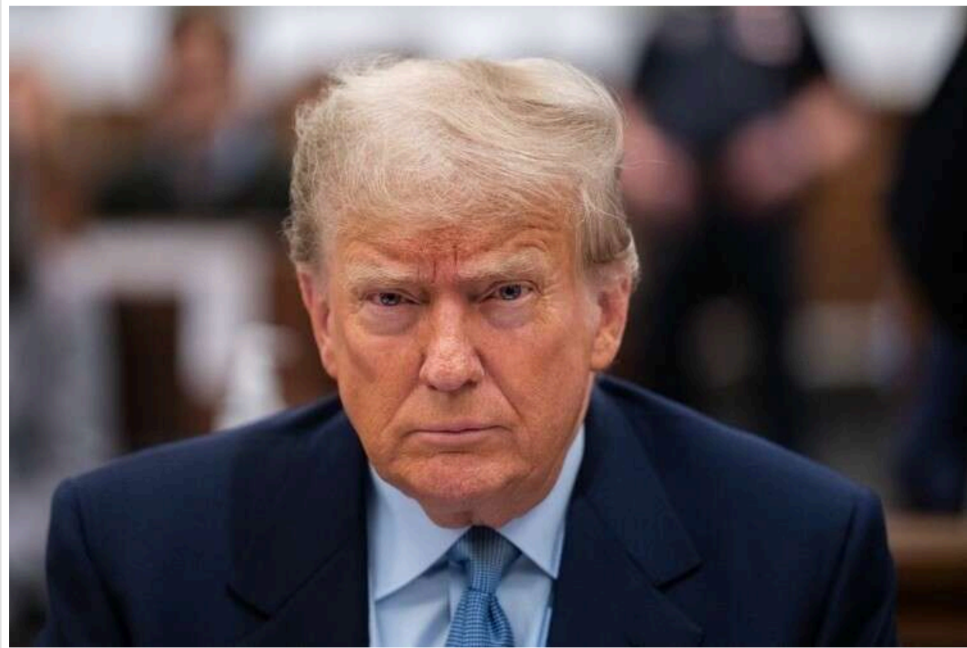
"Іноді потрібні ліки": Дональд Трамп прокоментував падіння ринків на тлі нових мит

Незважаючи на втрати на ринках у трильйони доларів, президент США Дональд Трамп не відмовляється від митної політики. Він порівняв нові тарифи з "ліками".