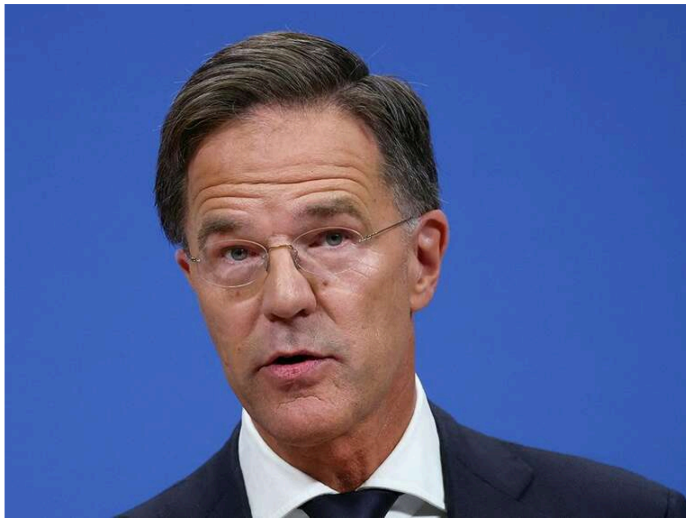
Росія повинна "зробити більше" для припинення війни в Україні, - Рютте

Генеральний секретар НАТО Марк Рютте висловив сумніви щодо того, що керівництво РФ зможе диктувати Вашингтону умови стосовно припинення вогню в Україні. Натомість Кремль дійсно має продемонструвати щире бажання припинити війну.