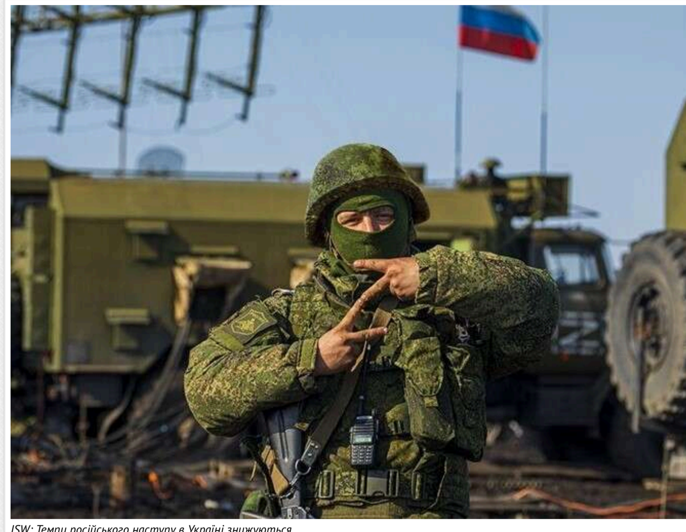
ISW: Темпи російського наступу в Україні знижуються

З листопада 2024 року швидкість просування російських військ в Україні неухильно знизилася. Це частково було спричинене успішними контратаками Сил оборони на східних напрямках фронту.