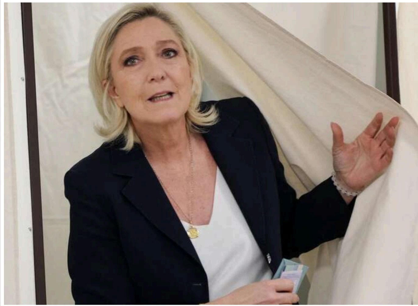
Ле Пен пообіцяла не здаватися та боротися до кінця за право брати участь у президентських виборах

Марін Ле Пен, лідерка фракції "Національне об'єднання" у французькому парламенті, пообіцяла боротися до кінця за право балотуватися на наступних президентських виборах, оскільки вважає суддівський вирок зневагою до верховенства демократії.