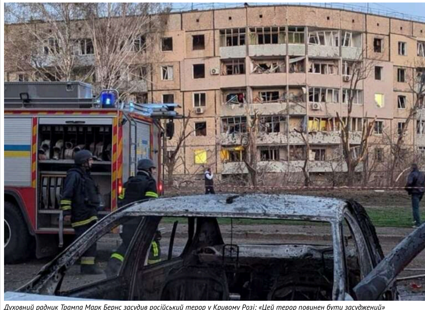
Духовний радник Трампа Марк Бернс засудив російський терор у Кривому Розі: «Цей терор повинен бути засуджений»

Духовний радник президента США Дональда Трампа, доктор Марк Бернс, висловив свою рішучу позицію щодо терористичного акту, вчиненого російськими військами в Кривому Розі.