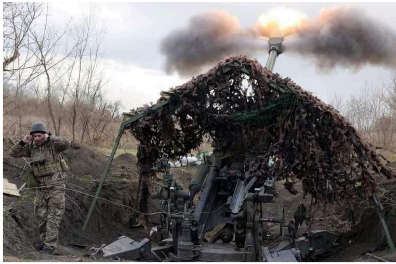
DeepState підтверджує просування російських військ в районі Лимана

Український військовий аналітичний ресурс DeepState підтвердив складну ситуацію для Сил оборони України на напрямку Лимана.