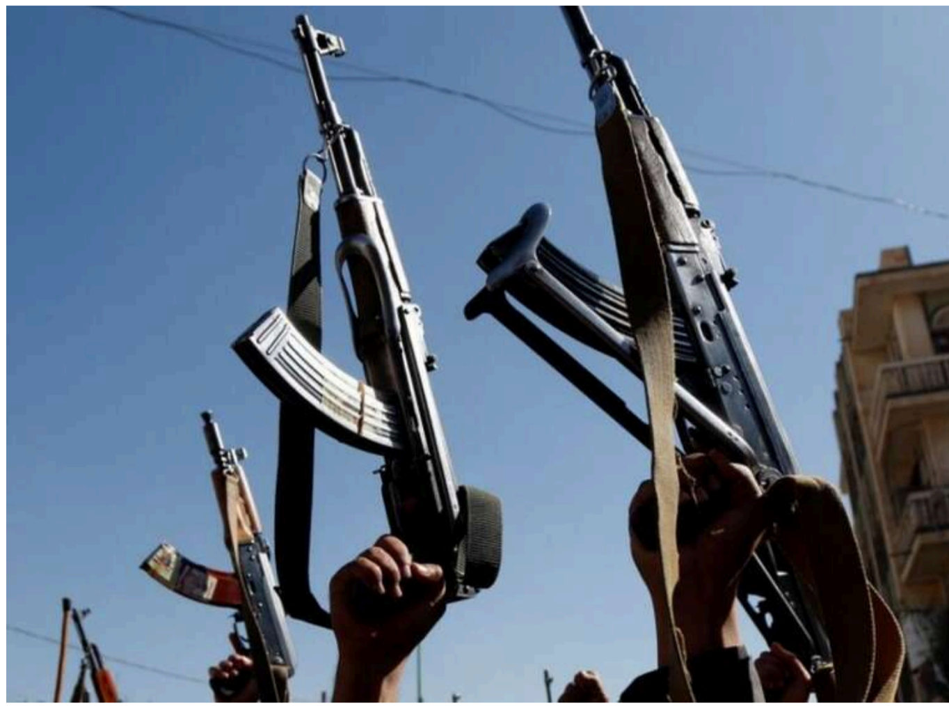
США ослабили хуситів ударами, але для перемоги буде потрібна наземна операція – аналітики

Як повідомляє CNN, попри удари США по єменських хуситах, без наземної операції перемогти їх буде важко.