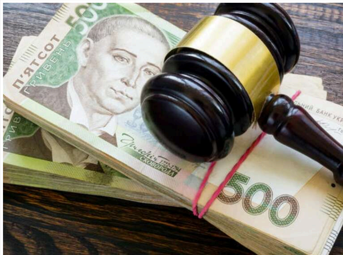
На Одещині військовий отримав 17 000 гривень штрафу за спробу відбити брата-дезертира у поліції

У місті Білгород-Дністровський Одеської області суд оштрафував військовослужбовця на 17 тисяч гривень за спробу завадити затриманню його брата, який самовільно залишив військову частину.