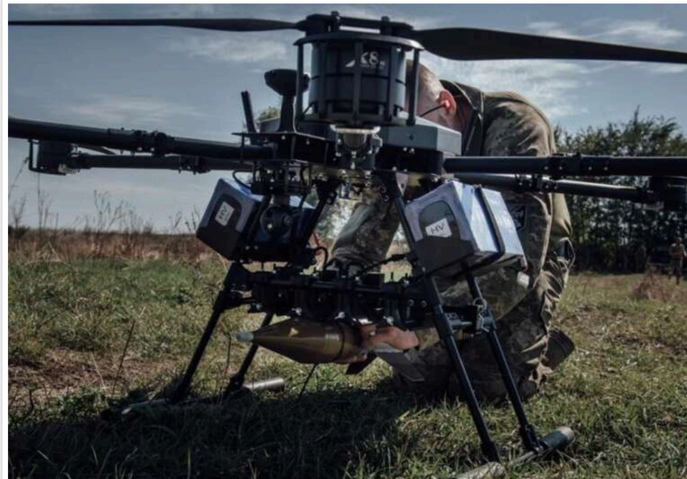
Дрони «Баба Яга» знищили 11 позицій окупантів на Харківщині - ДПСУ

Аеророзвідники 4-го прикордонного загону Державної прикордонної служби за допомогою дронів "Баба Яга" знищили одинадцять позицій російських окупантів у Харківській області.