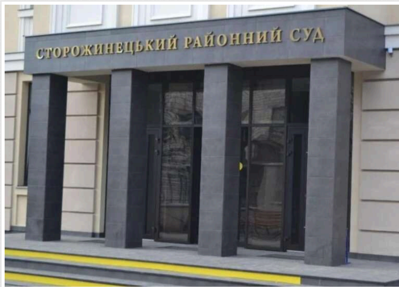
Сторожинецький суд засудив військового до 8 років ув'язнення за незаконне переправлення ухилинтів через кордон

Сторожинецький районний суд Чернівецької області визнав чоловіка винуватим у незаконному переправленні кількох осіб через державний кордон з корисливих мотивів.