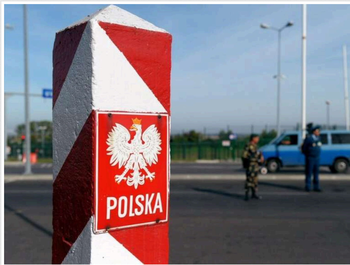
У Польщі повідомили, що ситуація на кордоні з Білоруссю ускладнилася

Ситуація на кордоні між Польщею та Білоруссю загострилася. Причиною цього є агресивні мігранти, які намагаються потрапити до Польщі.