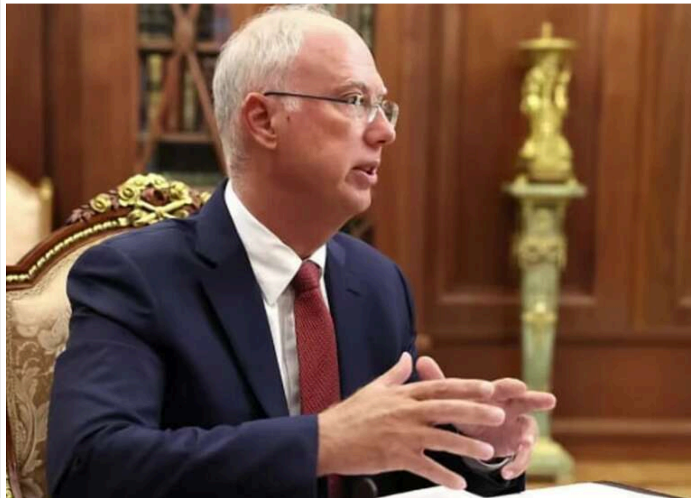
Москва і Вашингтон можуть відновити контакти вже наступного тижня, - спецпредставник Росії Дмитрієв

За його словами, Росія бачить "перші поважні кроки з боку США" і висловлює обережний оптимізм щодо відновлення діалогу.