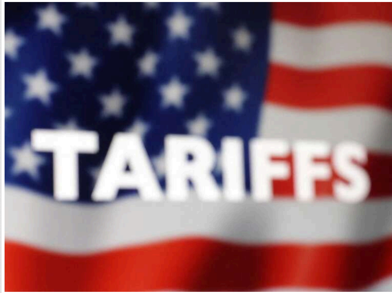
Представники бізнесу США і В'єтнаму звертаються до Трампа з проханням відкласти введення 46% мит

Американські та в'єтнамські компанії звернулися до адміністрації Трампа з проханням відкласти заплановане введення 46% тарифів на в'єтнамські товари, зазначивши, що це негативно вплине на них та двосторонні комерційні відносини.