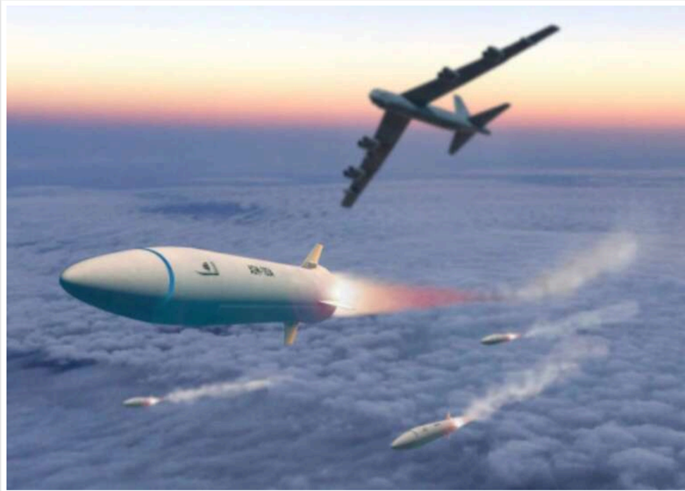
Велика Британія успішно завершила випробування нового двигуна для гіперзвукових ракет, розробленого у співпраці зі США - Міноборони країни

Міністерство оборони Великобританії повідомило про успішне завершення тестування нового двигуна для гіперзвукових ракет, розробленого в рамках співпраці з США. Випробування були проведені в дослідницькому центрі NASA в США, де за підсумками тестувань було проведено 233 успішних запуски, що підтверджують ефективність і надійність нової технології.