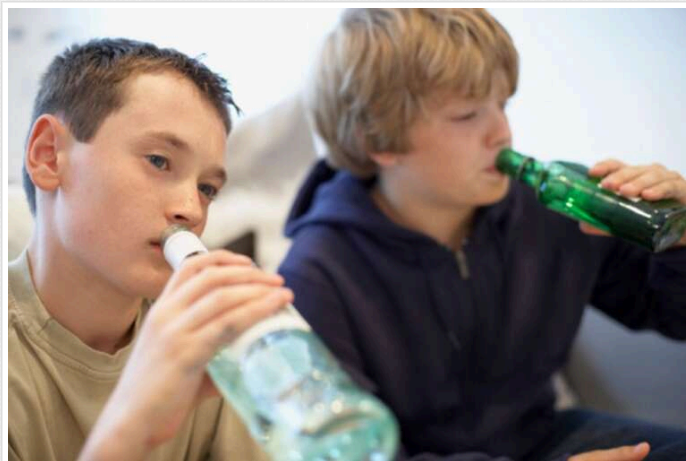
Хлопці 10-14 років в Одеській області вживають алкоголь частіше, ніж підлітки, - дослідження

Згідно з результатами дослідження, проведеного обласним центром контролю та профілактики хвороб Одещини, хлопці віком 10-14 років вживають алкоголь більше, ніж підлітки старшого віку.