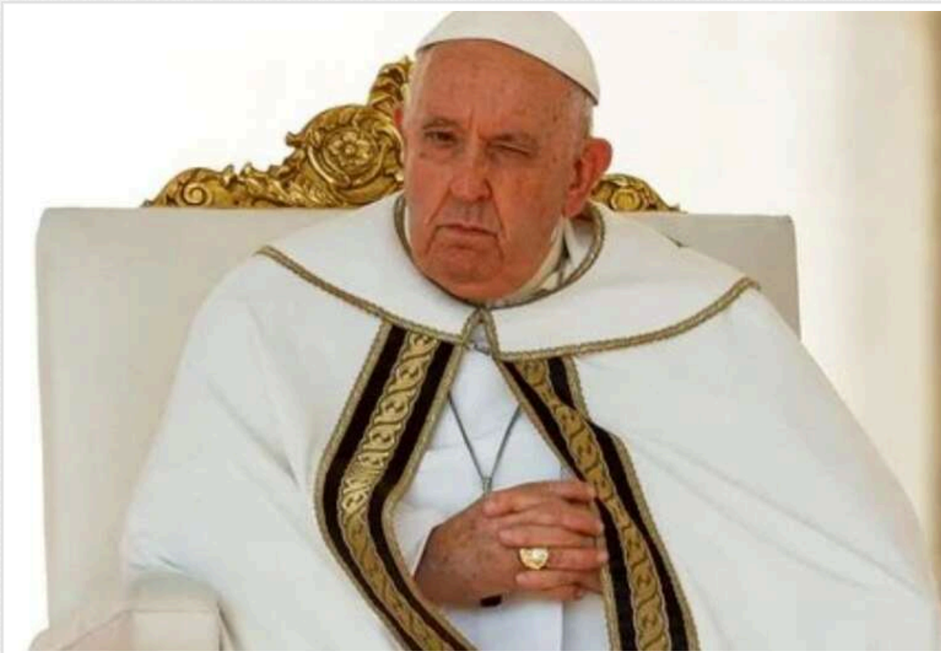
Папа Римський після довгої госпіталізації раптово з'явився перед вірянами

Папа Римський Франциск після виписки з лікарні, де він перебував на тривалому лікуванні від пневмонії, несподівано з'явився перед вірянами, які зібралися на площі Святого Петра у Ватикані.