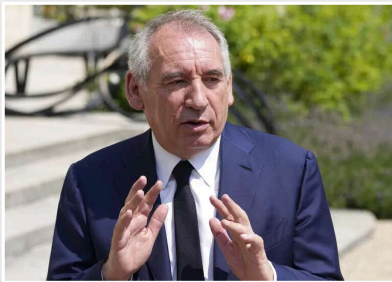
Прем'єр Франції поділився, як тарифи Трампа позначаються на економіці держави

Прем'єр-міністр Франції Франсуа Байру заявив, що через тарифну політику президента США Дональда Трампа зростання ВВП Франції може зменшитись на 0,5%.