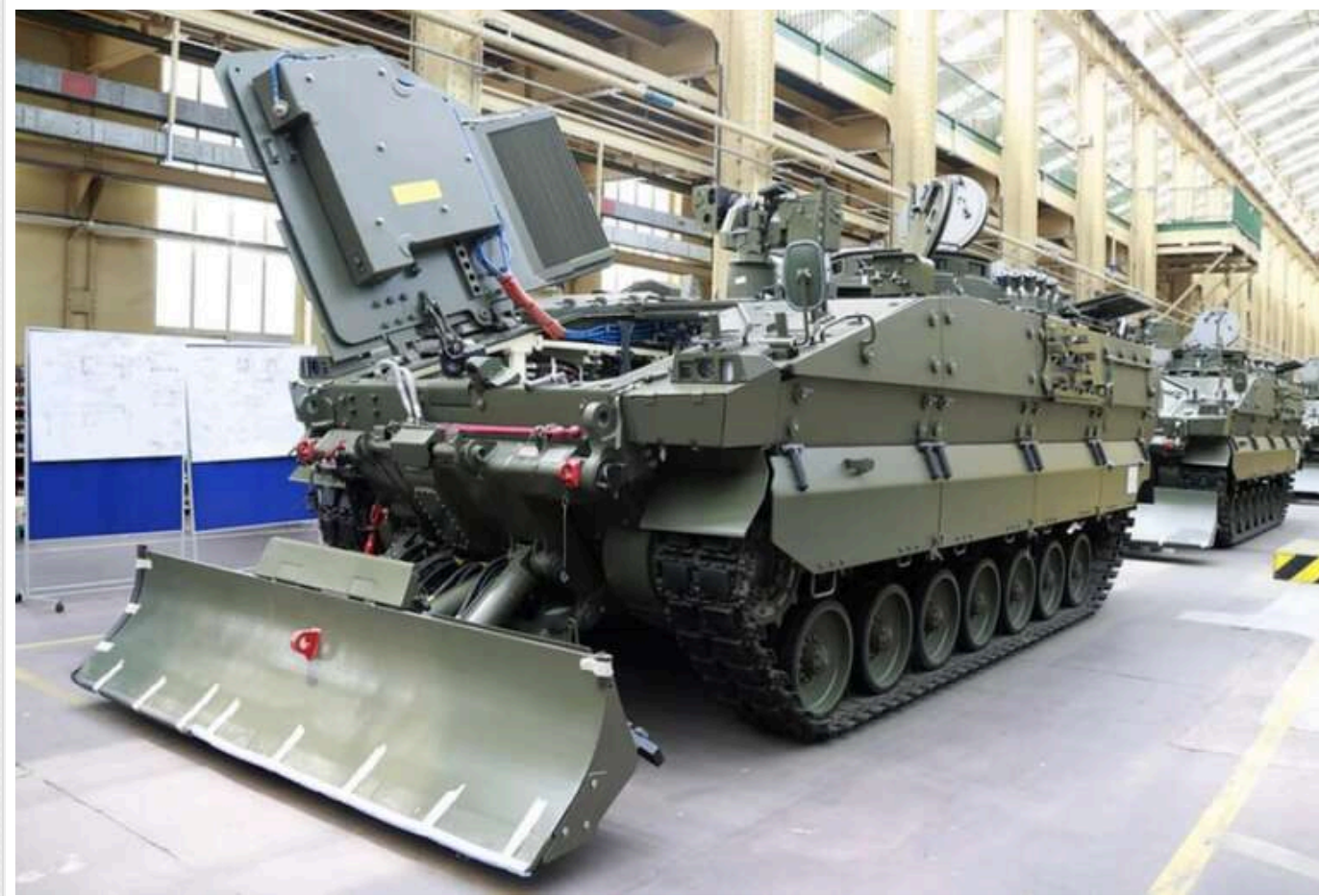
Латвія придбає в Іспанії БМП на суму 373 мільйони євро

Латвія уклала договір з іспанською компанією "GDELS-Santa Bárbara Sistemas" на постачання Національним збройним силам (НЗС) 42 бойових машин піхоти ASCOD загальною вартістю 373 млн євро.