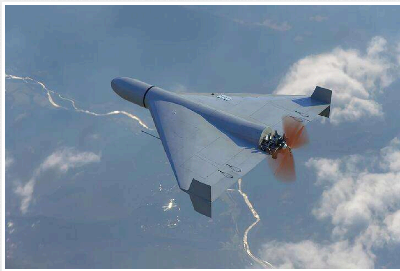
На Сумщині прикордонники збили «шахед» за допомогою стрілецької зброї

У ніч проти 6 квітня війни Сил оборони збили 13 ракет та 40 дронів, якими Росія атакувала Україну. Щонайменше один "Шахед", спрямований ворогом на Сумщину, збили українські прикордонники, зробивши це за допомогою стрілецької зброї.