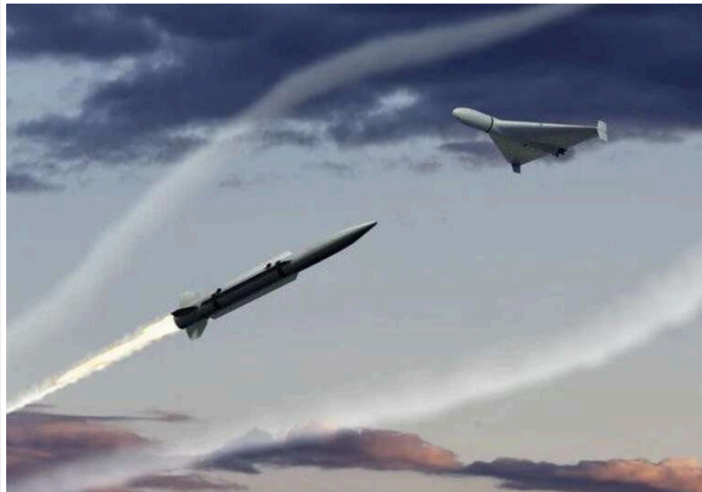
Росія за тиждень випустила по Україні понад 1460 авіабомб і майже 670 дронів - Зеленський

Президент Володимир Зеленський повідомив, що лише за минулий тиждень Росія здійснила масовані атаки по Україні, застосувавши понад 1460 керованих авіаційних бомб, майже 670 ударних дронів та понад 30 ракет різних типів.