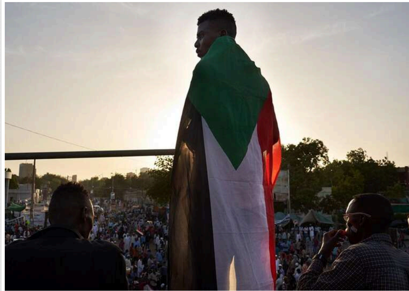
США анулюють візи всім громадянам Південного Судану через відмову приймати депортованих

Адміністрація США анулює всі чинні візи громадян Південного Судану та припиняє видачу нових. Таке рішення ухвалено через відмову перехідного уряду країни приймати назад своїх громадян, яких депортує Вашингтон.