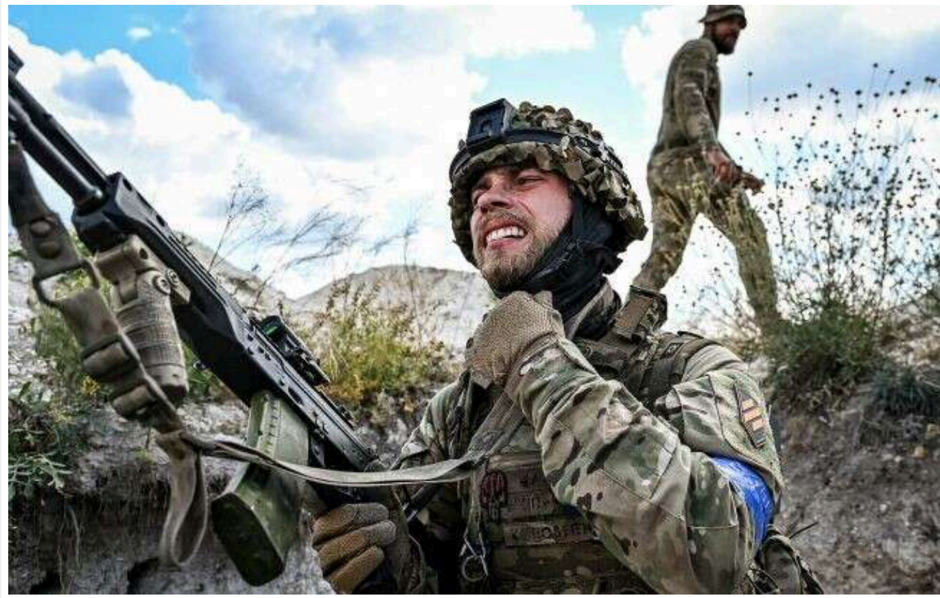
Рютте нагадав, що росіяни планували святкувати парад перемоги на початку березня 2022-го: Подивіться, де ми зараз

Генсек НАТО Марк Рютте заявив, що Збройні сили України вражають, нагадавши, що Росія планувала перемогти Україну ще в березні 2022 року.