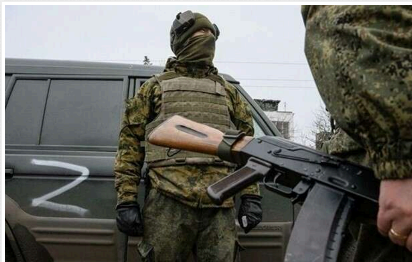
"АТЕШ": На Херсонщині окупантам заборонили користуватись мобільними телефонами

У Херсонській області російські окупаційні війська цілком переходять на дротовий зв'язок. У зв'язку з цим солдатам країни-агресорки заборонили використовувати мобільні телефони – причина цього полягає у великій кількості втрат, яких Сили оборони України завдають супротивнику за допомогою радіоелектронної розвідки.