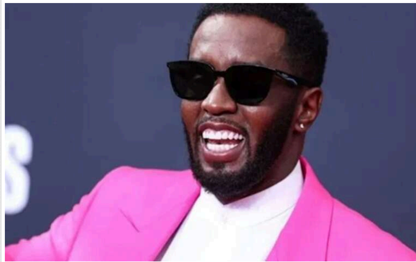
Проти репера P. Diddy висунули нові звинувачення, – CNN

Скандал навколо американського репера та бізнесмена Шона "Дідді" Комбса (P. Diddy) продовжує розростатися. Менш ніж за місяць до початку гучного судового процесу в Нью-Йорку федеральна прокуратура висунула артисту два нових обвинувачення – у секс-торгівлі та перевезенні людей з метою їхнього залучення до проституції. Обидва обвинувачення охоплюють період з 2021 по 2024 роки.