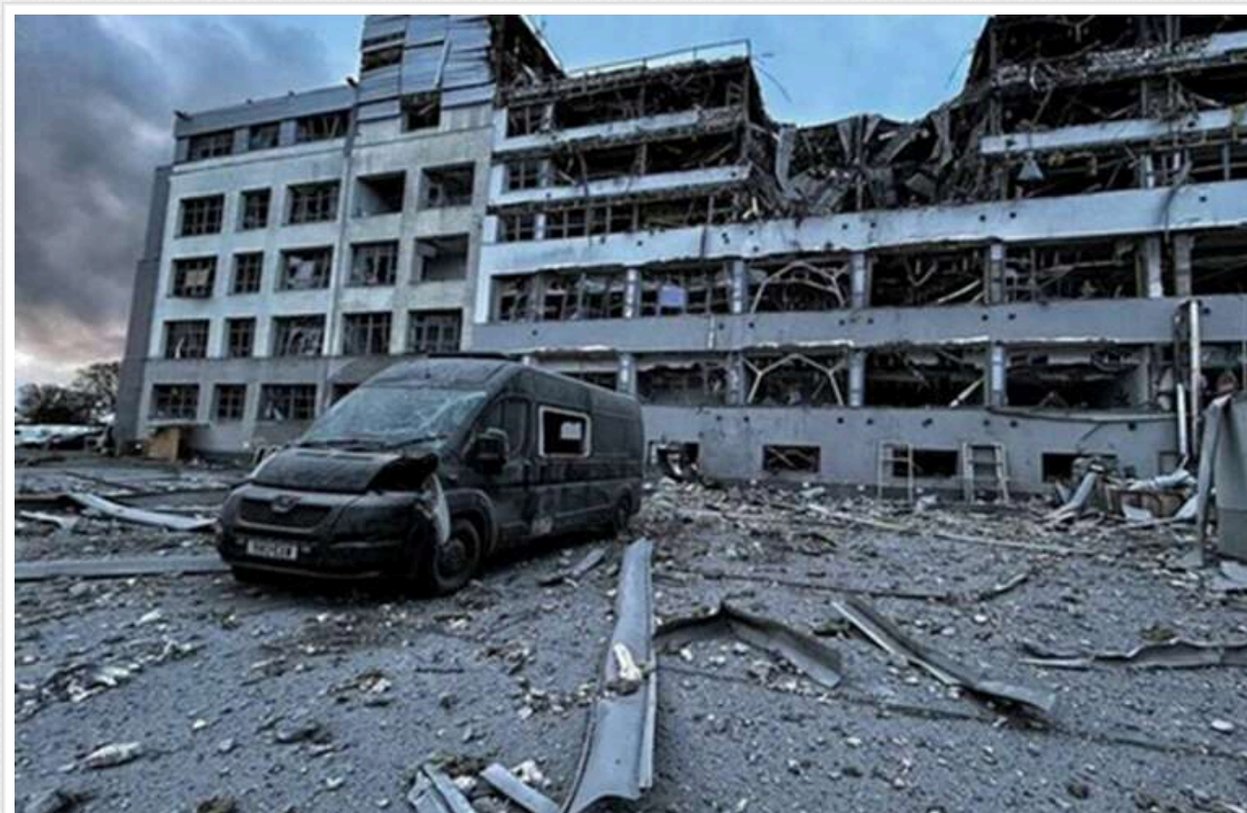
Виставлений на продаж за 23 мільйони доларів: У Києві російська атака знищила БЦ Grey Plaza

Бізнес-центр складався зі шести будівель висотою від двох до семи поверхів кожна, його загальна площа становила 33 тисячі квадратних метрів. Сам центр був чудовим місцем для бізнес-спільноти, зокрема, мав спортклуб, відділення банку, ресторан, кафе, а також зони відпочинку з мангалами та затишними локаціями.