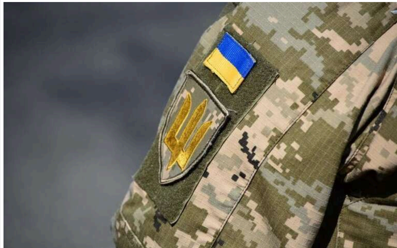
У Дніпропетровській області люди завадили ТЦК мобілізувати хлопця

Військові комісари та поліція намагалися мобілізувати молодого чоловіка в Дніпропетровській області, але перехожі цьому завадили.