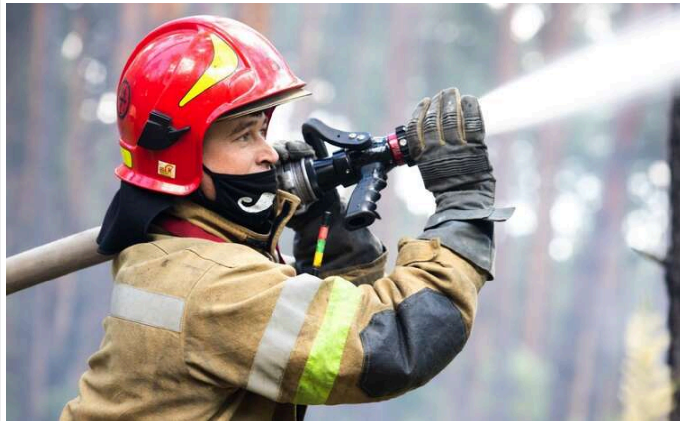
В ОВА уточнили наслідки атаки на Миколаїв: кількість постраждалих зросла до 4

Увечері, 5 квітня, російська армія атакувала Миколаїв дронами. Постраждали четверо людей, почалося кілька пожеж, які вже загасили.