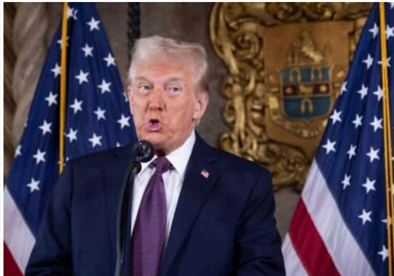
Трамп може запропонувати країнам, які постраждали від підвищення мит, угоду з купівлею «вхідного квитка»