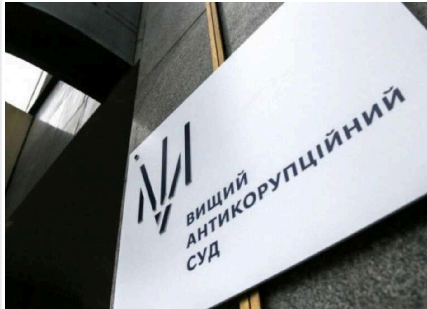
ВАКС застосував запобіжний захід до судді, який був учасником суддівсько-адвокатської мафії на Одещині

4 квітня 2025 року Вищий антикорупційний суд (ВАКС) ухвалив рішення про застосування запобіжного заходу до чинного судді, який є частиною злочинної організації, що діяла в рамках судової системи Одеської області. Мова про групу, яка допомагала військовозобов'язаним незаконно виїжджати за кордон та отримувати відстрочку від мобілізації через фальшиві судові рішення.