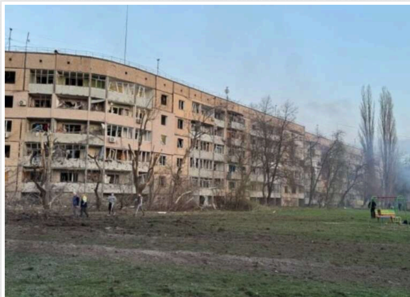
Росія завдала удару по Кривому Рогу касетною балістичною ракетою, щоб підвищити число жертв серед цивільних, - ЦПД

Росіяни завдали удар по житловому району Кривоого Рогу, використовуючи касетну балістичну ракету, з метою максимальної кількості жертв серед цивільного населення.