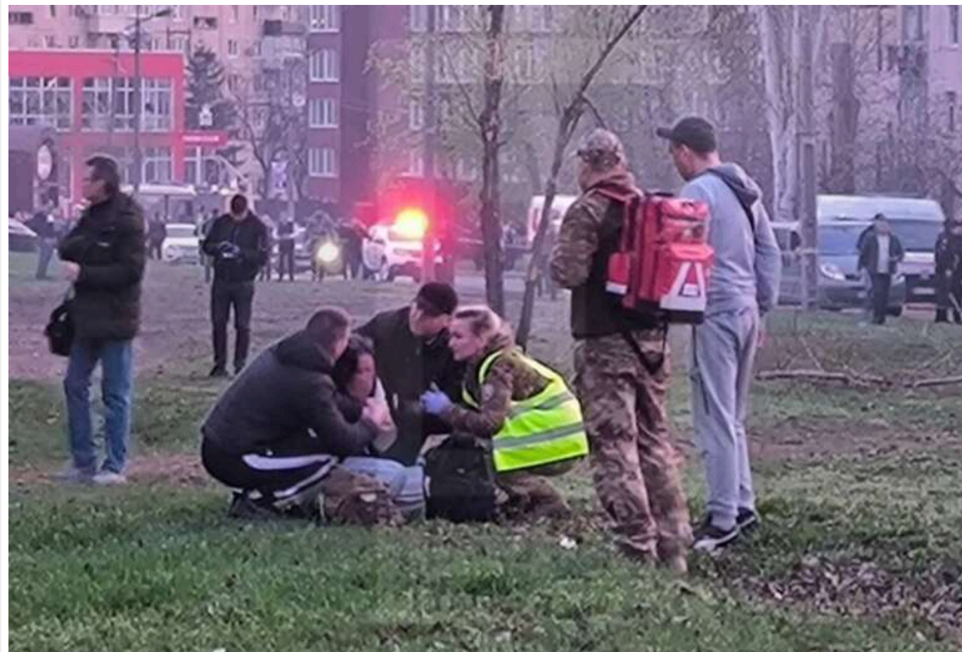
У Кривому Розі завершили аварійно-рятувальні роботи: 18 загиблих, 61 постраждалий

У ніч проти 5 квітня в Кривому Розі завершилися аварійно-рятувальні роботи після масованого ракетного удару Росії.