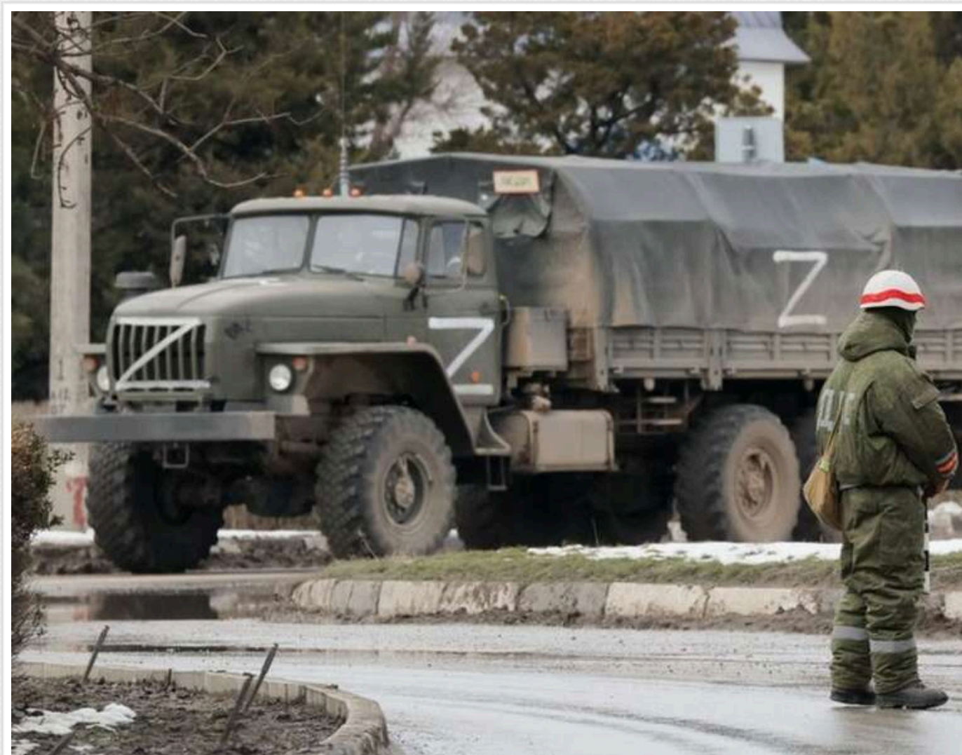
Нацполіція встановила трьох окупантів, які катували й гвалтували мирне населення в Рубіжному

Українські правоохоронні органи ідентифікували трьох військовослужбовців Російської Федерації, які причетні до жорстокого поводження з цивільним населенням у тимчасово окупованому Рубіжному Луганської області.