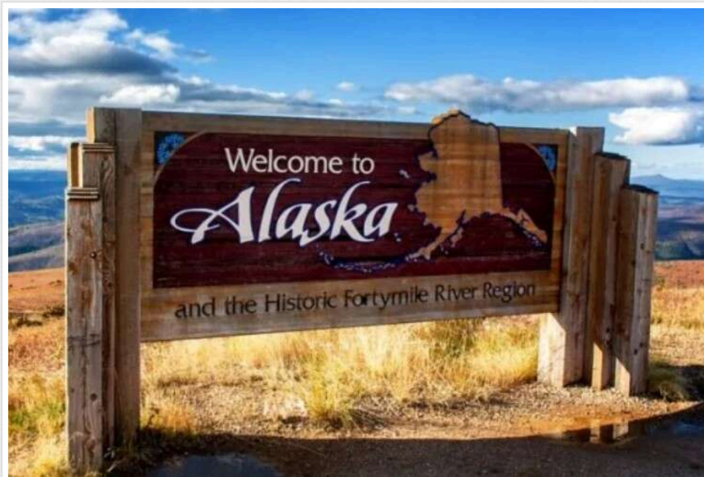
Жителі американського острова Крузенштерн почали вивчати російську на випадок "захоплення Росією", – The Economist

Жителі американського острова Малий Діюмід (острів Крузенштерн) почали вивчати російську мову на випадок "російського поглинання".