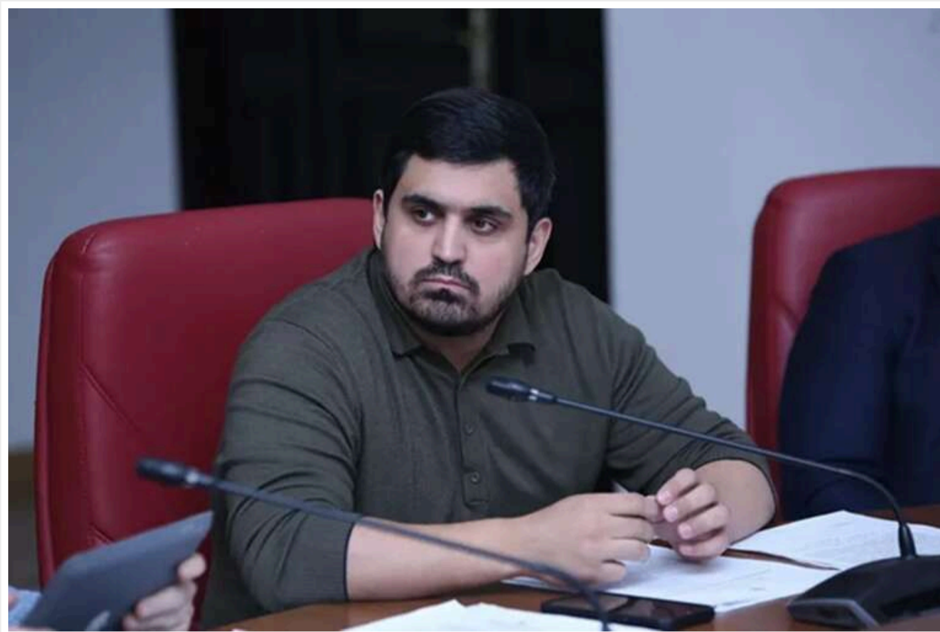
Кличко розширює повноваження: Київрада підтримала рішення, що обурило очільника КМВА Ткаченка

Керівник КМВА відгукувся на проєкт, переданий до Київради міським головою, який передбачає передачу цивільній адміністрації всіх важелів управління містом, зменшуючи контроль з боку депутатів, одночасно розв'язуючи собі руки.