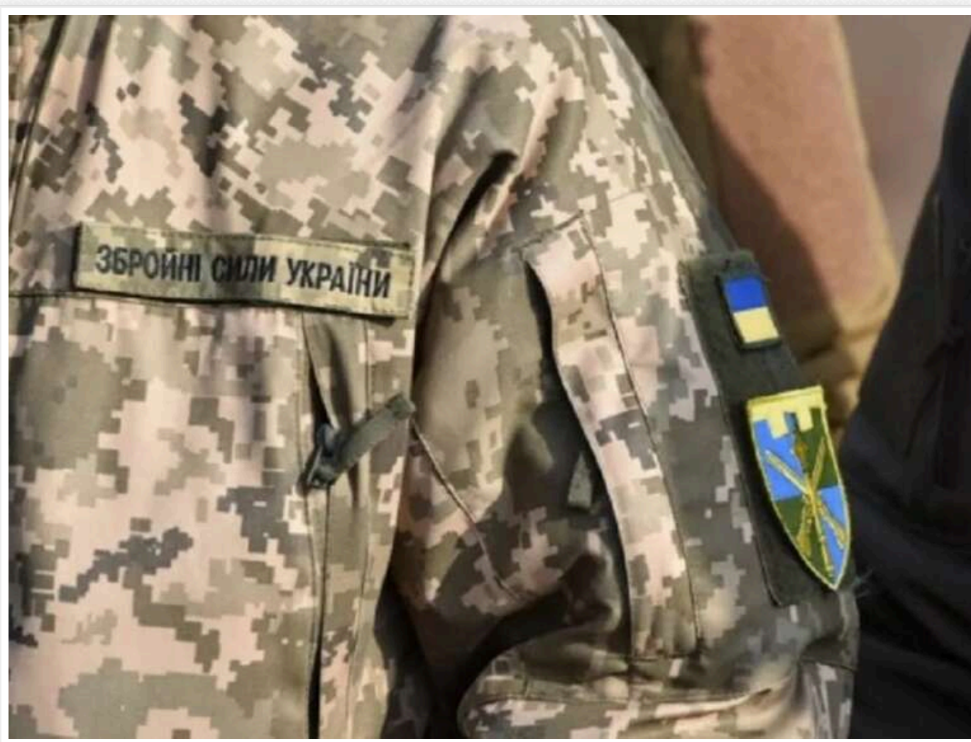
Скільки минулоріч в Україні відкрили справ по СЗЧ і дезертирству, - ЗМІ

Кількість дезертирів та військових, що самостійно пішли зі своїх підрозділів, порівнянна з темпами мобілізації, – дані за 2024 рік.