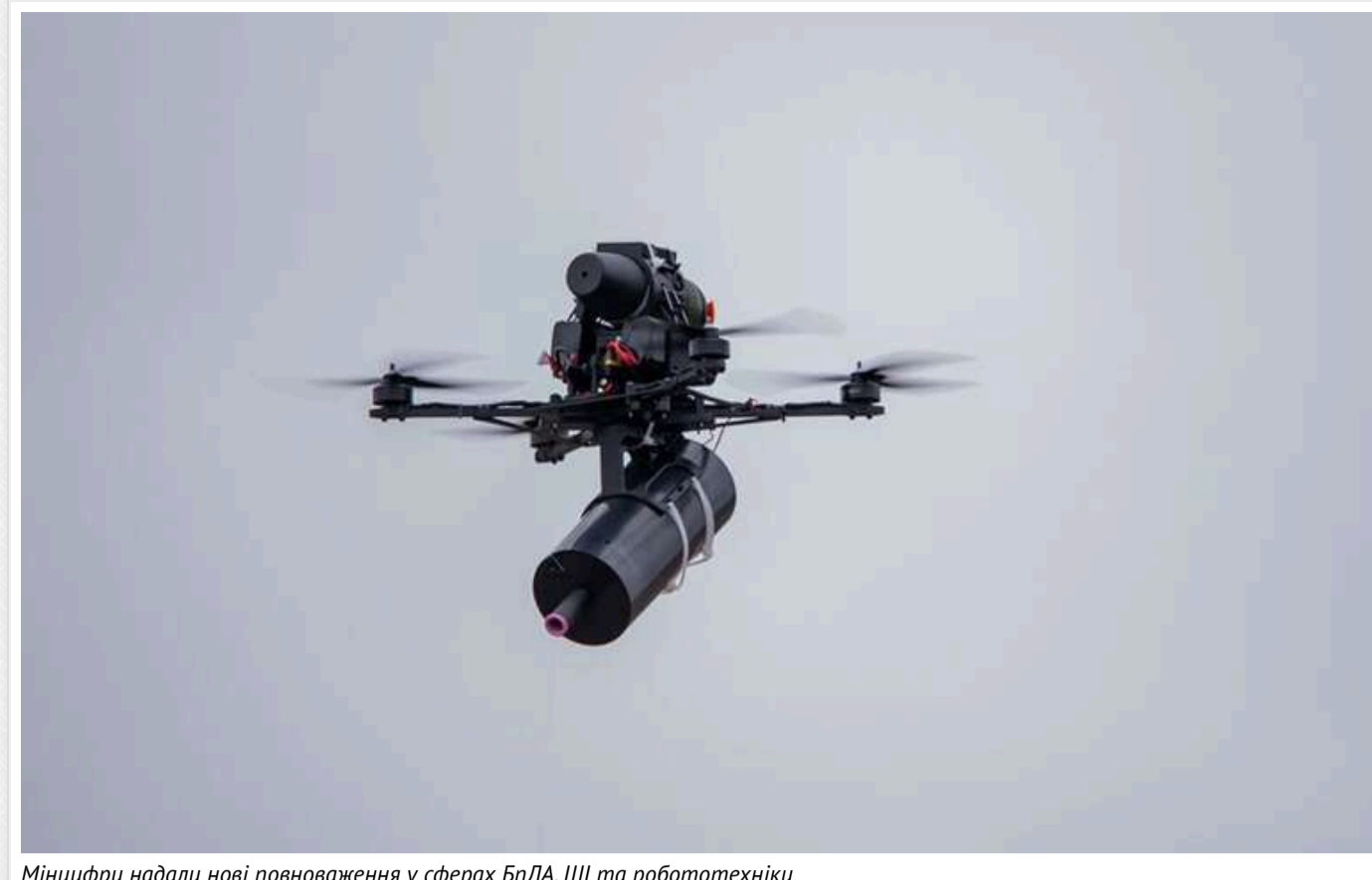
Мінцифри надали нові повноваження у сферах БПЛА, ШІ та робототехніки

Кабмін надав Міністерству цифрової трансформації України (Мінцифри) нові повноваження, які стосуються політики у галузі робототехніки, напівпровідникових технологій та штучного інтелекту. Мінцифри буде відповідальне за визначення, регулювання та організацію процесів, де ці сфери перетинаються з обороною країни.