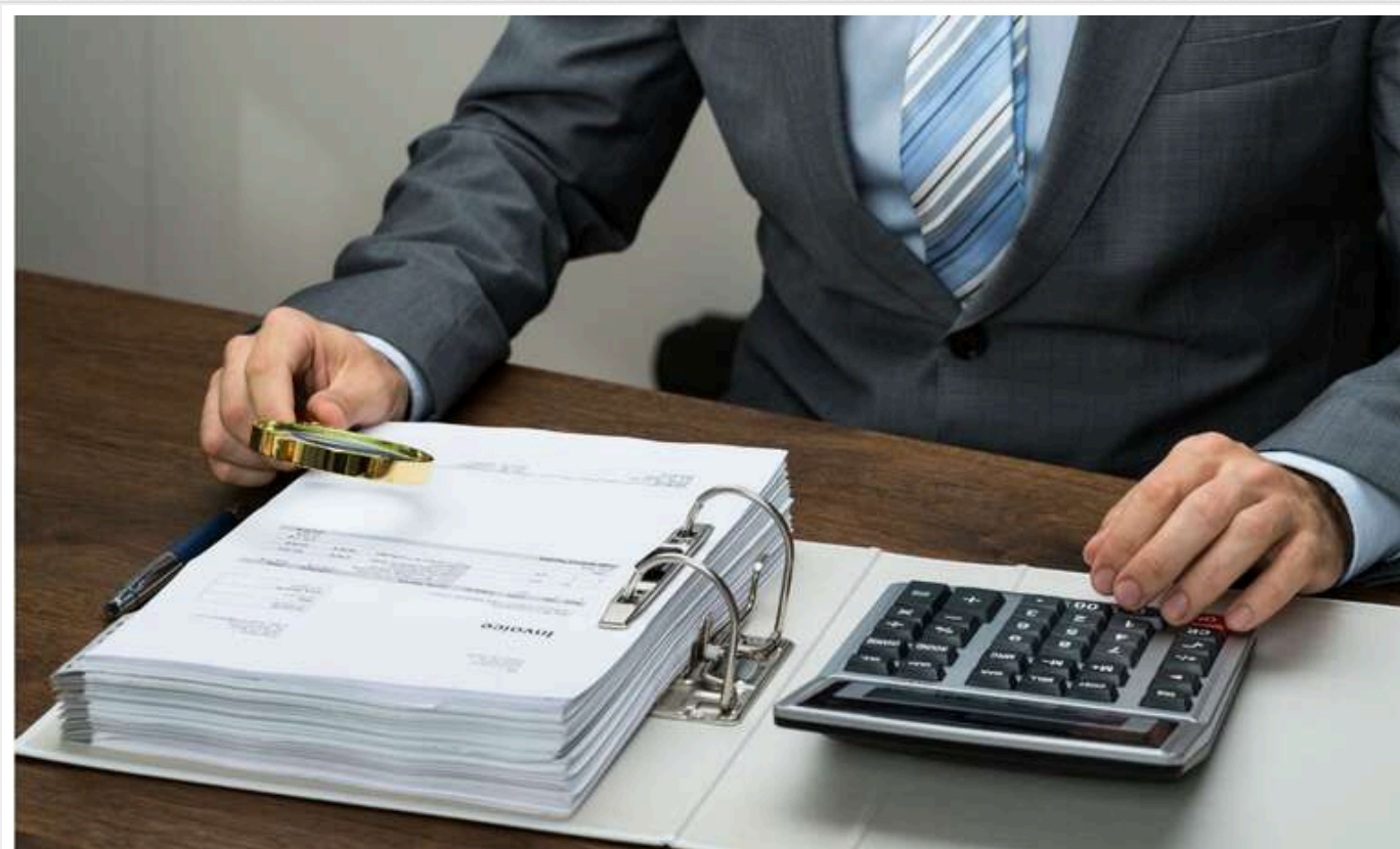
На Одещині хочуть зробити ремонт харчоблоку за 22 мільйони із завищеними цінами на будматеріали

Відділ освіти Усатівської сільської ради Одеської області 26 березня за результатами тендеру замовив ТОВ «Давмір Строй» капітальний ремонт харчоблоку ідальні Усатівського ліцею за 21,75 млн грн.