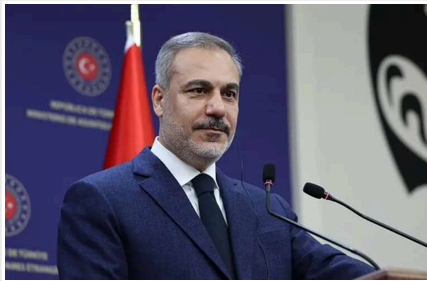
У Туреччині вважають, що будь-яка мирна угода між Україною та Росією краща за продовження війни

Глава МЗС Туреччини Хакан Фідан вважає, що будь-яка мирна угода між Україною та Росією краща, ніж продовження війни.