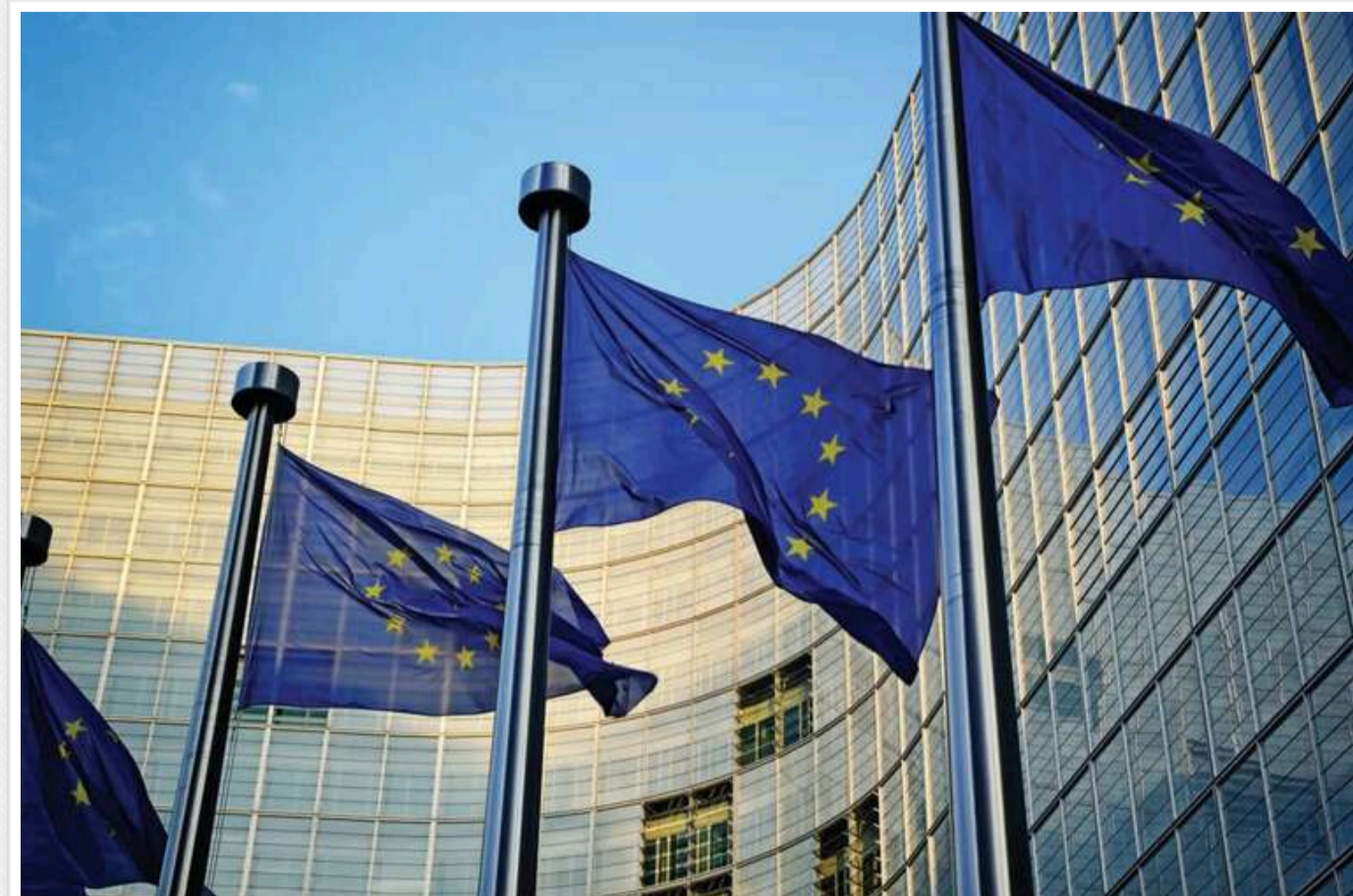
FT: ЄС готується до екстрених заходів через загрозу дешевих товарів із Китаю

Євросоюз планує вжити заходів проти Китаю, щоб уникнути напливу дешевих китайських товарів після введення мит Трампом, повідомляє Financial Times.