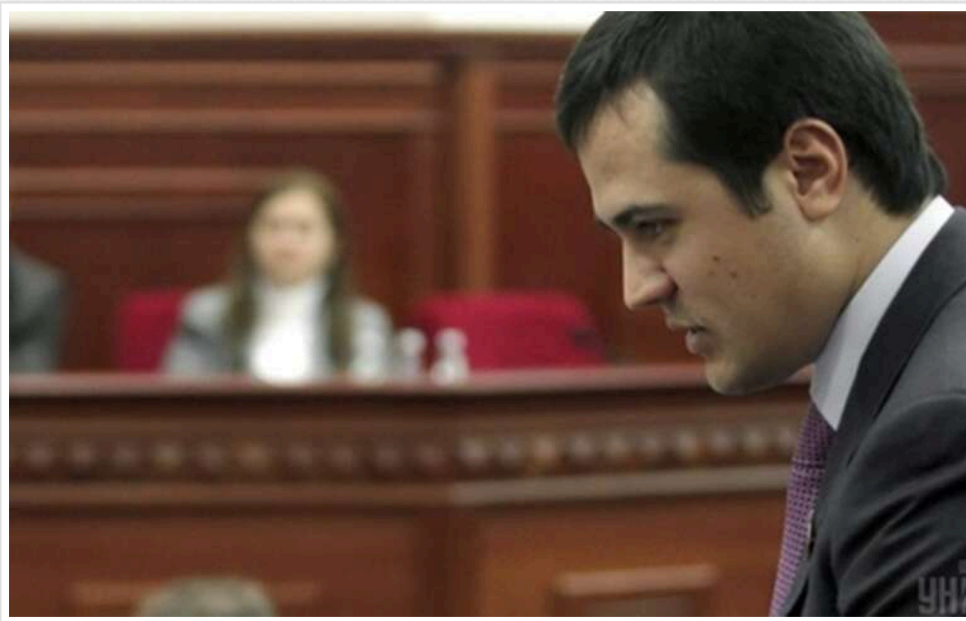
НАБУ оголосило в розшук помічницю "смотрящего за Києвом" Комарницького: пів мільйона євро та переповнені скриньки

Жінки висловлювали невдоволення тим, що грошей так багато, що скриньки в банках не здатні закритися.