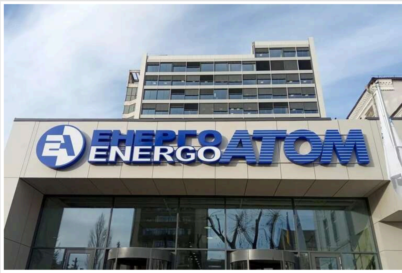
"Енергоатом" уклав "конфіденційний" контракт на трансформатори із "Запоріжтрансформатором" на 2,57 мільярда гривень

АТ «НАЕК «Енергоатом» 21 березня уклало угоду із ПрАТ «Запоріжтрансформатор» про закупівлю трансформаторів на 2,57 млрд грн.