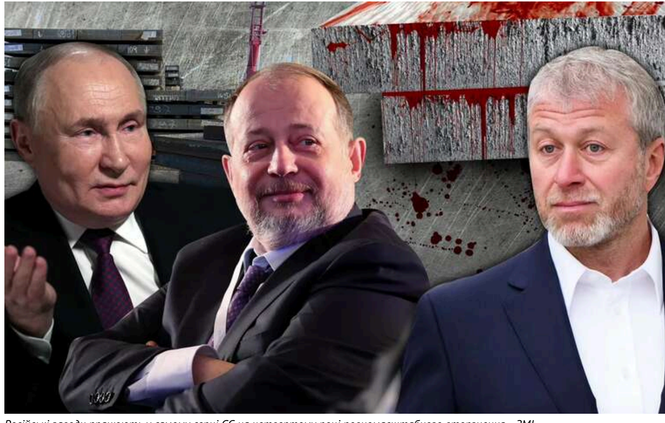
Російські заводи працюють у самому серці ЄС на четвертому році повномасштабного вторгнення, - ЗМІ

З 24 лютого 2022 року українське суспільство вже побачило багато прикладів цинічної гри західних партнерів з обох сторін. Наприклад, лише перед новим 2025 роком партнери, які протягом трьох років рішуче засуджували російську агресію, помітили існування "тіньового флоту" Росії, який, попри санкції, роками доставляв російську нафту по всьому світу. Це відбувалося не лише у всіх на очах, а й на радарях.