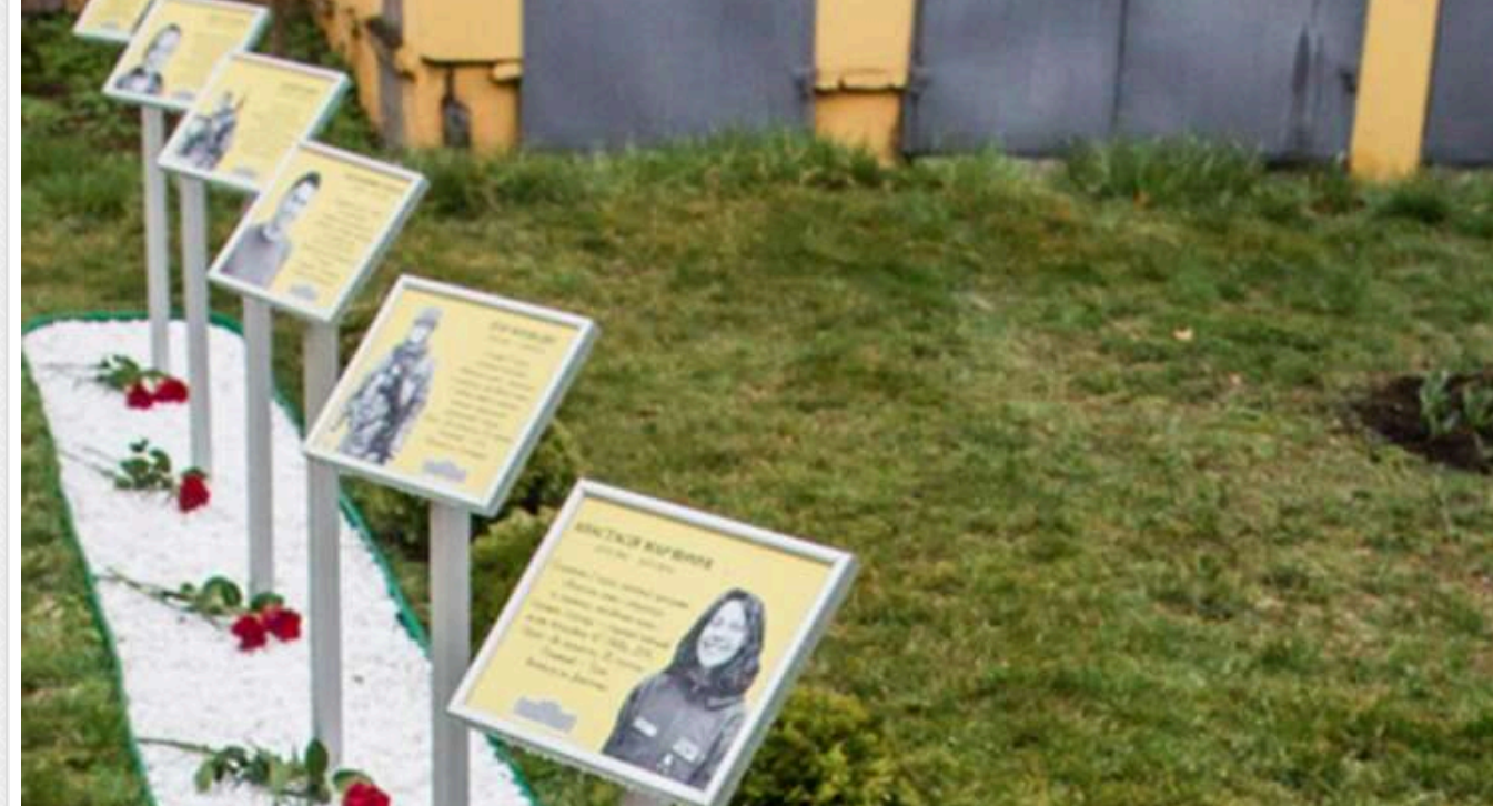
В університеті Шевченка з'явилася алея пам'яті загиблих студентів

У Києві урочисто відкрили алею пам'яті студентів, випускників та працівників інституту, які загинули в російсько-українській війні. П'ятеро з них пов'язані з Інститутом філології.