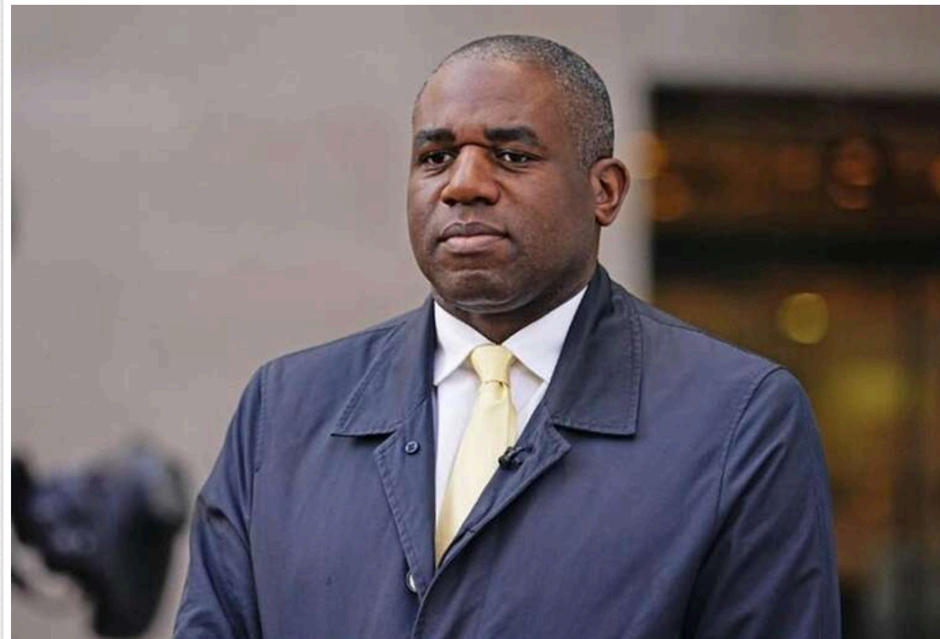
Глава МЗС Британії викрив цинічну тактику Кремля

Російський диктатор Володимир Путін не зацікавлений у мирному розв'язанні війни в Україні. Країна-агресорка Росія продовжує тероризувати українських громадян і завдає ударів по енергетичній інфраструктурі.