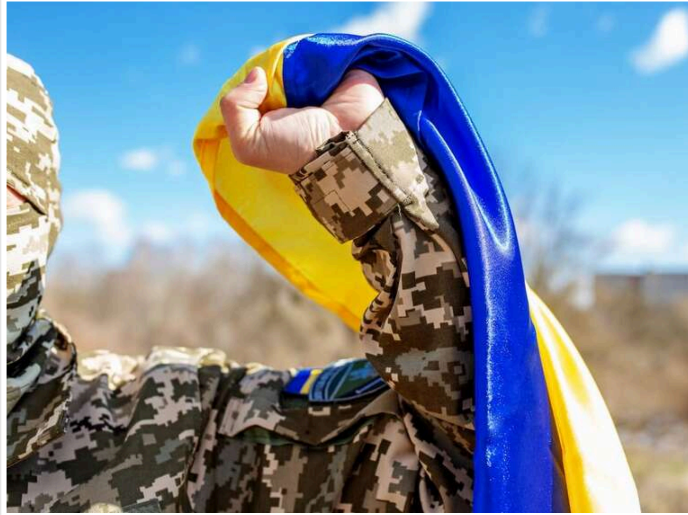
Генштаб: Військові матимуть пріоритетні дати для шлюбу онлайн

Невдовзі військові матимуть можливість обирати пріоритетні дати для укладення шлюбу онлайн завдяки застосунку «Армія+», – Генштаб.