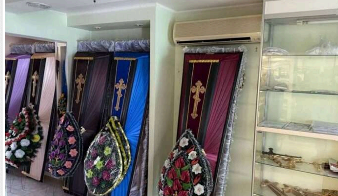
У Кривому Розі директор КП ритуальних послуг зі спільниками привласнили майже 7 мільйонів гривень

У справі фігурують 10 осіб, серед яких керівник КП Криворізької міськради, посадовці виконкому, підприємці та бухгалтери.