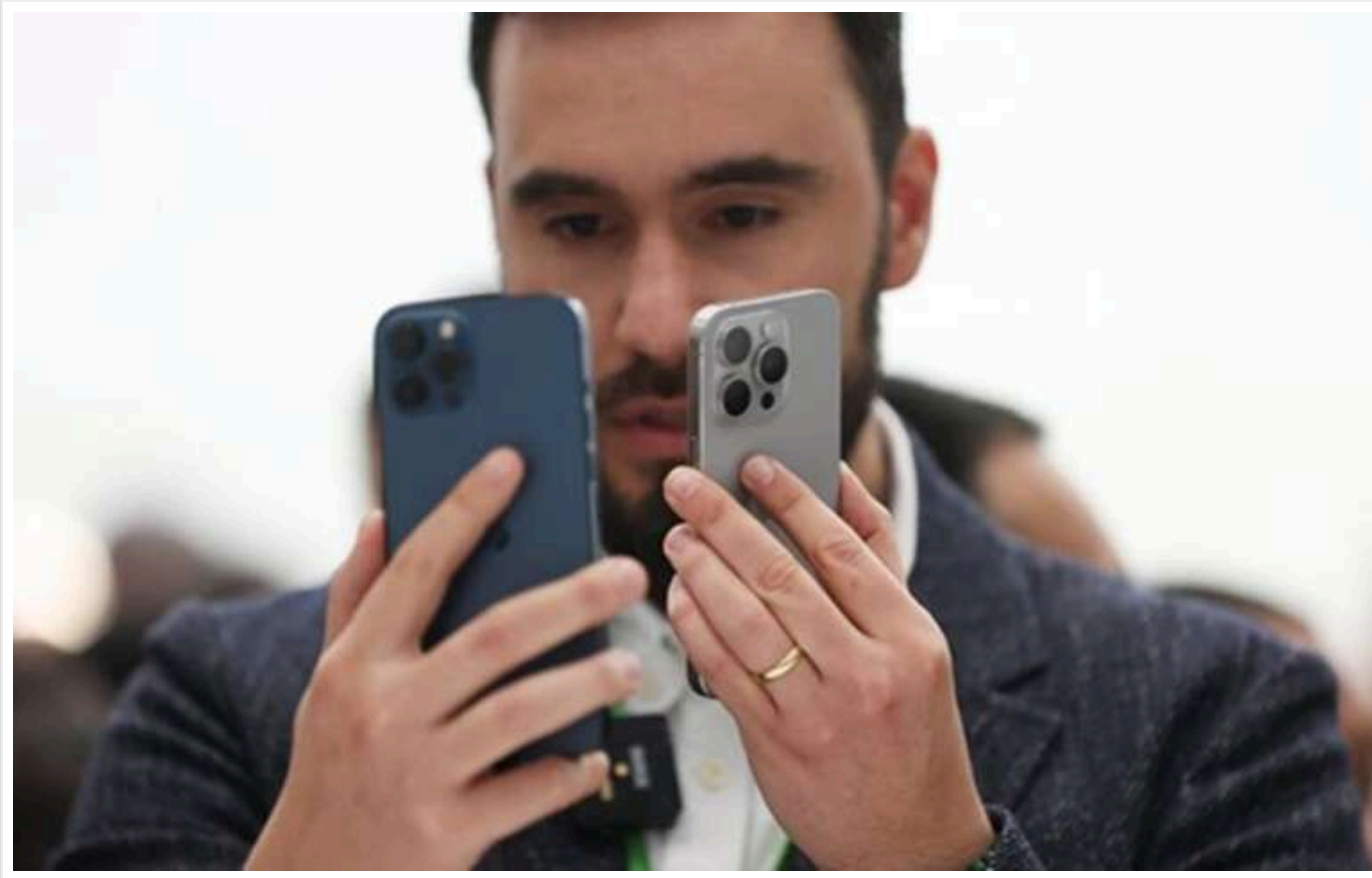
Імпортують напряду з Китаю і Тайваню: iPhone подорожчають у США, але не Україні, - економіст

Через нові мита, введені Трампом, айфони подорожчають у США, але не в Україні, оскільки їх імпортують напряду з Китаю та Тайваню без митних обмежень.